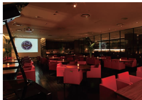
ニューヨークカフェ店内